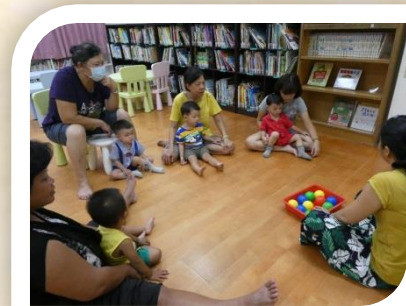
將軍據點遊戲屋的幼兒小團體課程