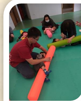
日間療育 | 體適能課