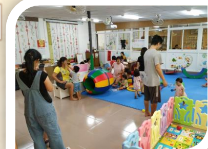
東山據點寶貝遊戲天地