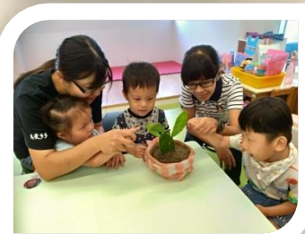
日間療育 | 主題活動